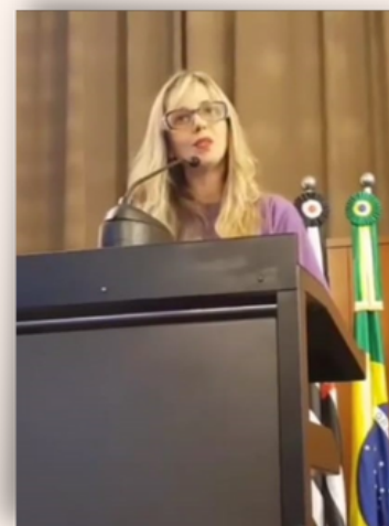
Figura 2: Participação no evento: Os desafios da legalização da maconha no Brasil, realizado na Câmara Municipal de São Paulo

agregadora de profissionais da área foi extremamente importante para dar voz à defesa da Cannabis medicinal, seja por pacientes e familiares como por profissionais das áreas biológica e da saúde, da área social e do direito. A partir deste momento, intensificou-se o diálogo em eventos de discussão oficiais (Figura 2), em programas de televisão e rádio e em eventos científicos.